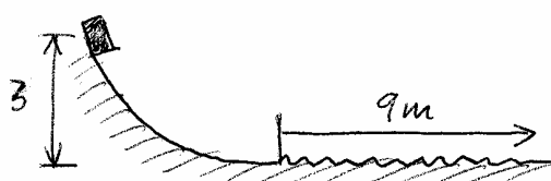
Figura del problema 6