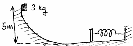
Figura del problema 4